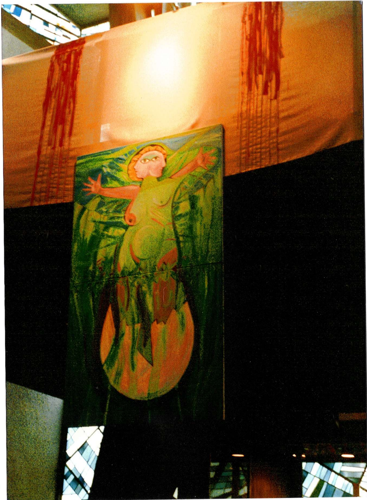
Das Foto oben stammt vom 22. Deutschen Evangelischen Kirchentag, der unter dem Thema „Seht, welch ein Mensch“ (Joh 19,5 LUT84) in Frankfurt am Main