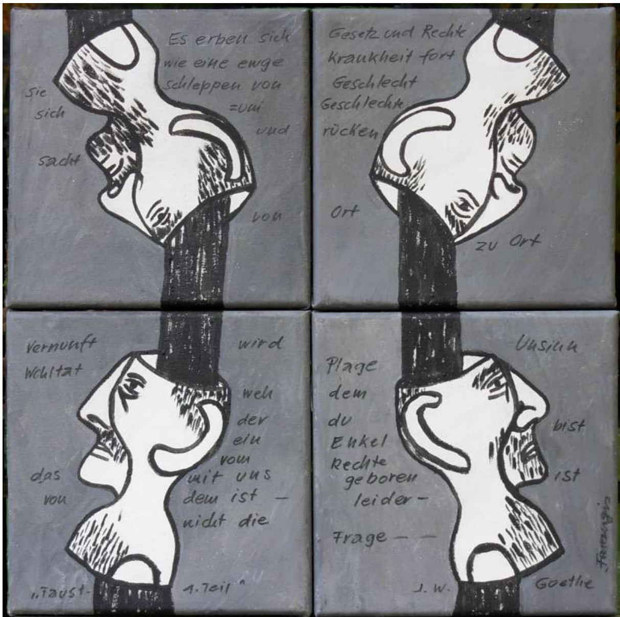
Farangis G. Yegane: Das Gefäß als Metapher, Reihe.